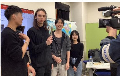
《イツコムでのテレビ取材がありました。》