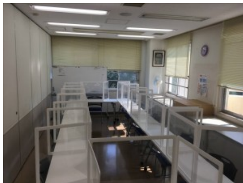
(卓上パーテーション使用例)