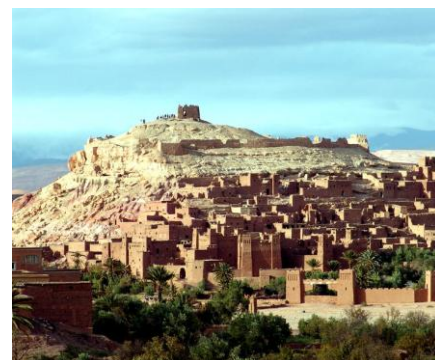
「モロッコ」 世界遺産 アイト・ベン・ハッドゥ

面積—日本の約1.2倍 人口—約3千万人 民族構成—アラブ系65%、ベルベル系30% 宗教—イスラム教 言語—アラビア語、フランス語