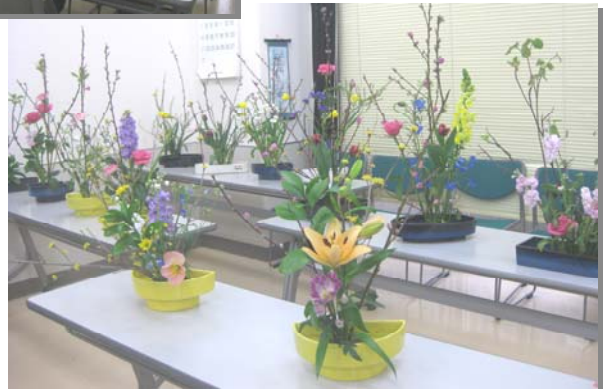
せいと 生徒さん達の作品