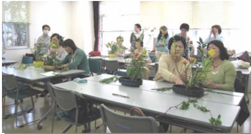
たの 楽しい教室風景