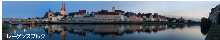
レーゲンスブルク

バーバリアンフォレスト、レーゲンスブルグ大聖堂、ストーンブリッジです。また、私の故郷のあるバイエルン州は州都がミュンヘンで、城や、教会などの歴史ある世界遺産が数多くありますので、是非来てください。