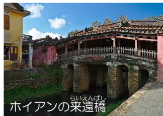
ホイアンの来遠橋

ホーチミン、ハノイは大都市で見どころが多いですが、お勧めは中部のフエ、ダナン、ホイアンです。世界遺産があり海がとてもきれいです。日本の皆さん是非一度ベトナムにお越しください。