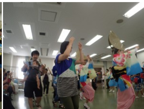
参加された中国からのお客様はサービスで浴衣を着付けてもらい、初めての日本の着物体験も同時に満喫、とても喜んで踊りを楽しんでおられました。