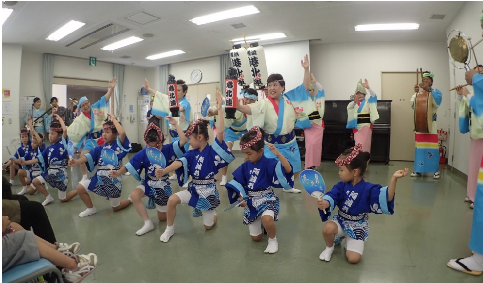
始めに本場徳島の阿波踊りの動画

6月16日(日)交流企画部イベント「阿波踊り体験」が開催されました。 前日までの嵐のような雨も上がり好天気、港北あわ連の皆様が ちびっこの踊り手さんも含め約25名出演されました。