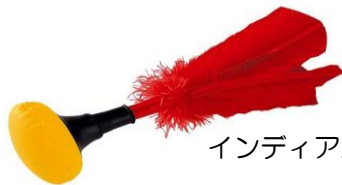
インディアカのシャトル