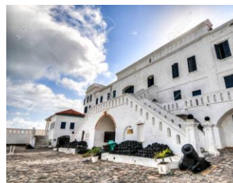
Cape coast and Elmina castles