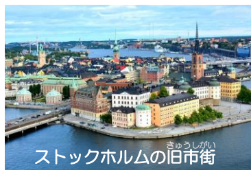
ストックホルムの旧市街

首都ストックホルムは見どころが数多くあります。冬は中部のウォームランドでスキートレッキングが楽しめます。北のハイコーストは自然が素晴らしく、ウェストコーストには小さな島々や村がありその自然がお勧めです。