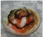
マレーシア・アイスカカン