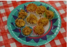
ハニーコーンフレーク